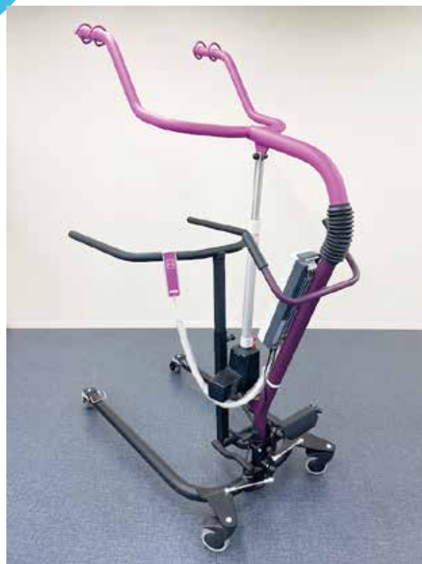
▼免荷機能付き歩行器(オールインワン)

荷機能付き歩行器を導入することになりました。従来、重症の方の立位・歩行訓練を行う際、長下肢装具と呼ばれる、つま先から太ももまでを固定し下肢での支持を支援する装具を使用することがあります。この装具の耐荷重が70kgであり、大柄の男性であると使用できないことでリハビリが進みにくい要因の一つとなっていました。他の免荷機能付き歩行器の耐荷重が80~100kgであるのに対して今回導入に至ったオールインワンは耐荷重150kgと優れたパワーを発揮できます。その為、従来平行棒を用いて2人のスタッフが患者様の体を支えながら足を振り出す支援を行い3mの往復程度しか歩行練習ができない方に対しても、1人のスタッフが動作を誘