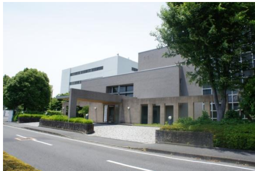
(写真左) アサヒ飲料